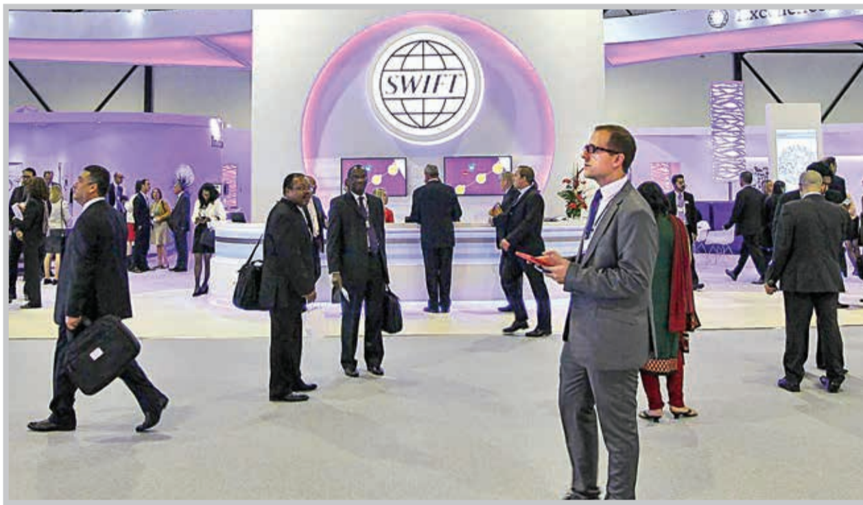
سه کشور آلمان، بریتانیا و فرانسه بانتشار نامهای وزیر خزانهداری آمریکا، خواستار آن شدند که تحریم‌های جدید شامل حال سوئیفت نشود. در صورتی که آمریکا موافقت نکند امکان همکاری اقتصادی با ایران از سوی کشورهای اروپایی محدود خواهد شد.

برجام از سوی ایران، ممنوعیت خدمات رسانی به بانک‌های ایرانی در سال ۲۰۱۶ لغو شد و پیوند بانک‌های ایرانی با شریان‌های مالی از طریق سوئیفت دوباره برقرار شد.