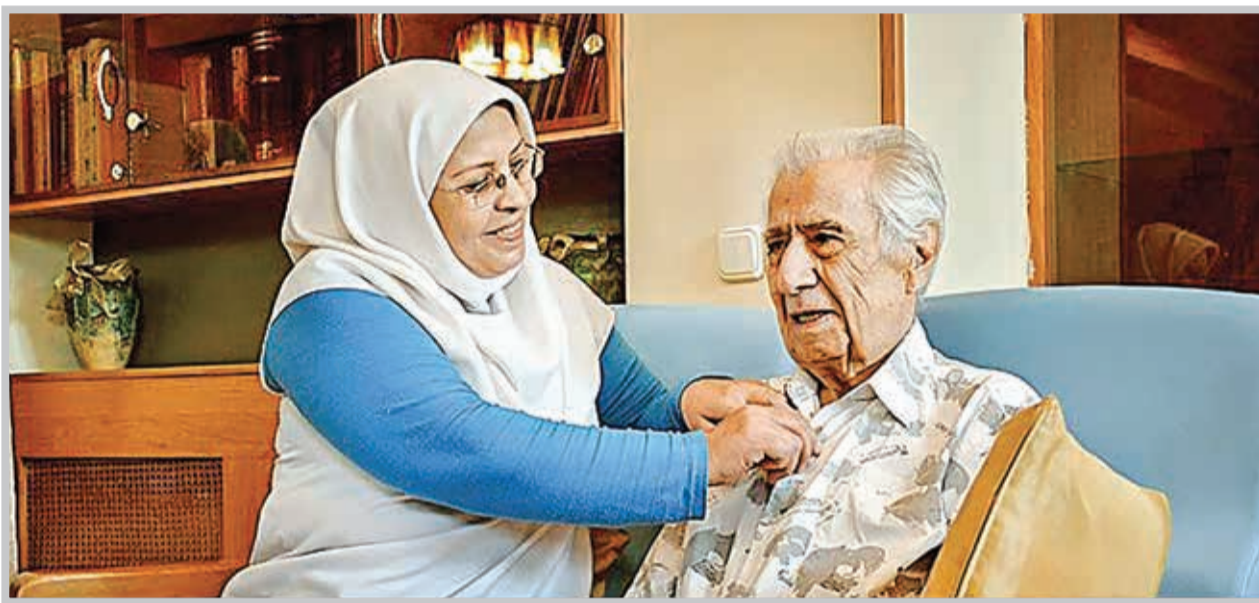
بیمه شدن خدمات پرستاری در منزل که با حمایت وزارت بهداشت سازمان تامین اجتماعی بیمه سلامت ایران اجراء می شود، برای دولت نیز منافع اقتصادی قابل توجهی به دنبال دارد و هزینه های نظام سلامت را در بخش های مراقبت و بستری کاهش می دهد.

بهاکاری سازمان تامین اجتماعی، پوشش بیمه ای طرح خدمات پرستاری در منزل، به صورت آزمایشی اجرا می شود