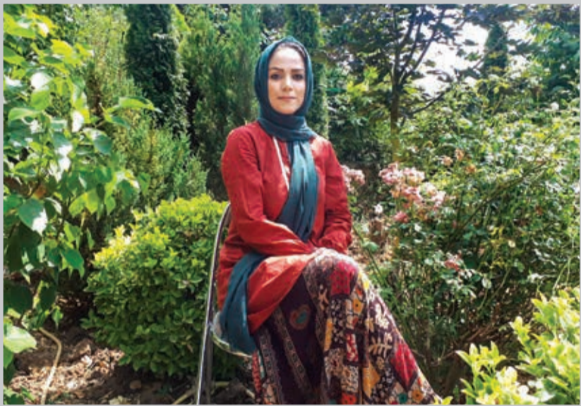
راحله برای بیش از شش نفر به صورت مستقیم کارآفرینی کرده‌است و نزدیک به بیست نفر به‌صورت غیرمستقیم به این پروژه وابسته هستند.