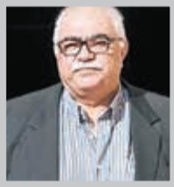
وجه زیادی از تصمیم‌گیری‌های اقتصادی کشور، در دهه گذشته به جز دورانی خاص، منطبق بر عقل سلیم نبوده‌اند و به همین دلیل دُمَل عفونی این گونه اشتباهات اکنون سر باز کرده

واژه به‌کارگرفته بی‌نظیر ایشان، یعنی فارغ‌التحصیلان بی‌مایه را در نظر داشته باشید در تصمیم‌سازی‌های اقتصادی کشور، ممکن است افراد صلاحیت سیاسی و امنیتی داشته باشند و احتمالاً آدم‌های خوبی هم باشند و هیچ‌گونه وابستگی به ذی‌نفعان هم نداشته باشند، اما می‌توان با توسل به عقل سلیم و تجارب کاربردی، مشاهده کرد که در تصمیم‌های اتخاذ شده، بعضی افراد اهلیت حرفه‌ای ندارند. بنابراین وقتی در مقام تصمیم‌گیری قرار می‌گیرند، مشکل‌ساز می‌شوند. این افراد بدون اهلیت حرفه‌ای اگر خود جزء ذی‌نفعان نباشند، به راحتی می‌توانند از ذی‌نفعان و بقایای