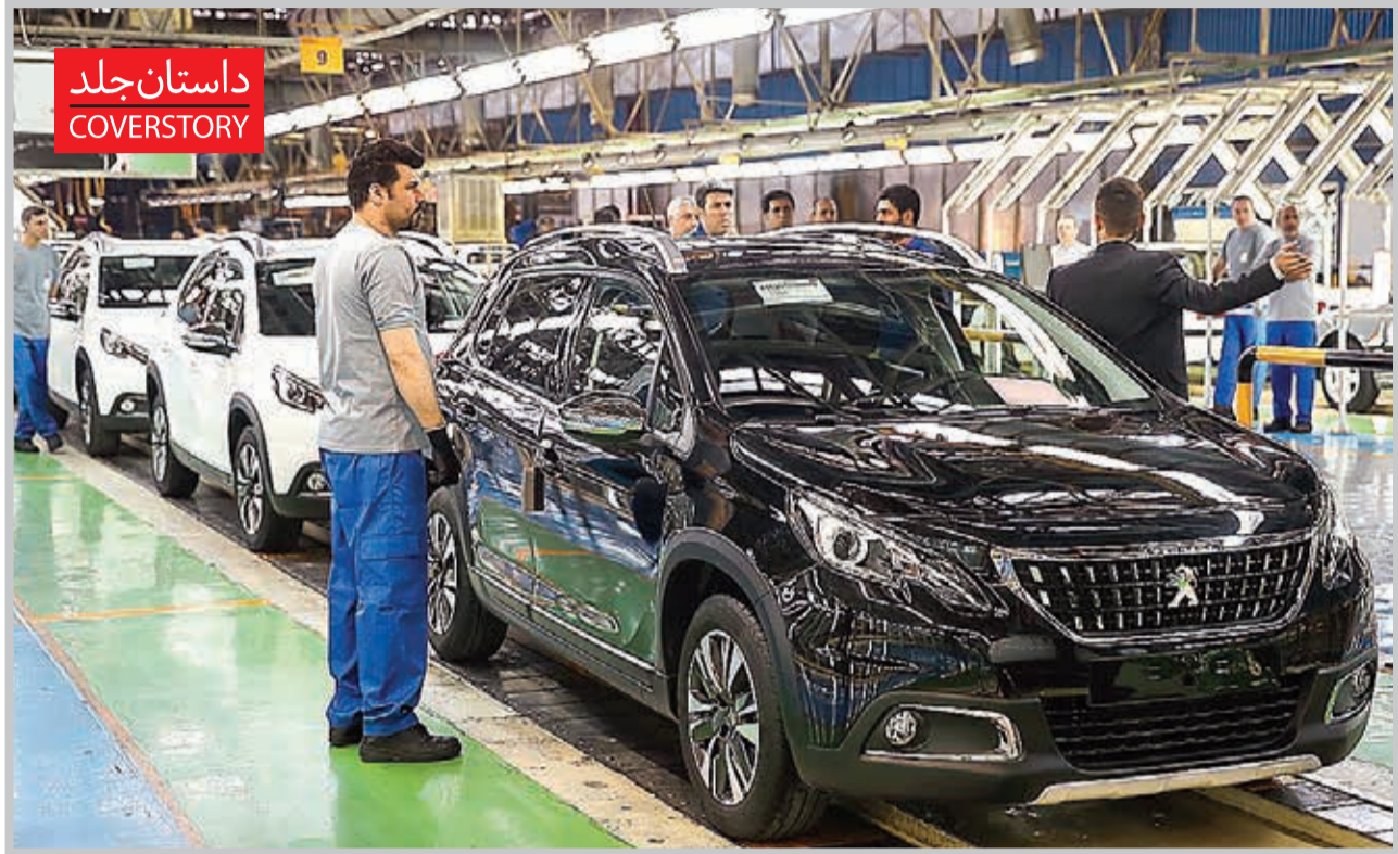
داستان جلد COVERSTORY