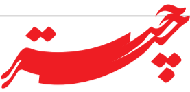
خبرها و نظرها تامین اجتماعی